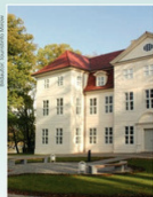
Der Bau des Schlosses wurde 1707 begonnen, dauerte ca. bis 1709 unter Adolf Friedrich II. 1753 erfolgte eine Umgestaltung durch Elisabeth Albertine.