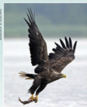
Deutschlands größtes Brutrevier von See- und Fischadlern befindet sich in der Seenplatte, insbesondere im Müritz-Nationalpark.